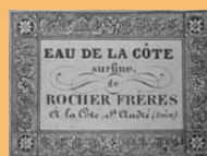
Etiquettes visibles au musée