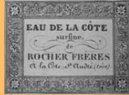
Etiquette visible au musée