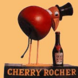
Affiche visible au musée

« La Maison ROCHER FRÈRES est sans contredit la première qui ait généralisé l'usage des liqueurs en France... Les liqueurs de Messieurs ROCHER FRÈRES ayant le double avantage d'être parfaites de qualité et très modérées de prix, ont acquis bien vite la réputation dont elles jouissent aujourd'hui, aussi, l'importance de cette maison est-elle toujours allée grandissant... Tout en dotant le Trésor d'un impôt considérable, elle a affranchi la France du tribut qu'elle payait à l'Autriche pour son Marasquin, à la Prusse pour son Eau-de-vie-de-Dantzig, à la Suisse pour son Absinthe, à l'Italie pour son Alkermès, à la Hollande pour son Curaçao ». (Extrait du Rapport Officiel de l'Exposition - un siècle de réclames, les boissons, F. Ghosland ed Milan)